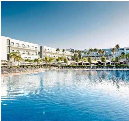
Hipotel Gran Conil

Unsere Herbstreise 2024 führt uns nach Andalusien – Costa de la Luz 13.9. bis 23.9.2024