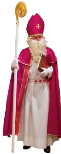
In Weseke kommt alljährlich der Nikolaus