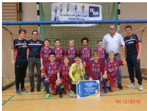
Foto: Der D-Jugend-Sieger SG Borken

Neben den Pokalen und Plaketten für die jungen Kicker konnten sich die Siegerteams der 3 Jahrgangsstufen auch noch über Kino – und Verzehrgutscheine für die gesamte Mannschaft freuen.