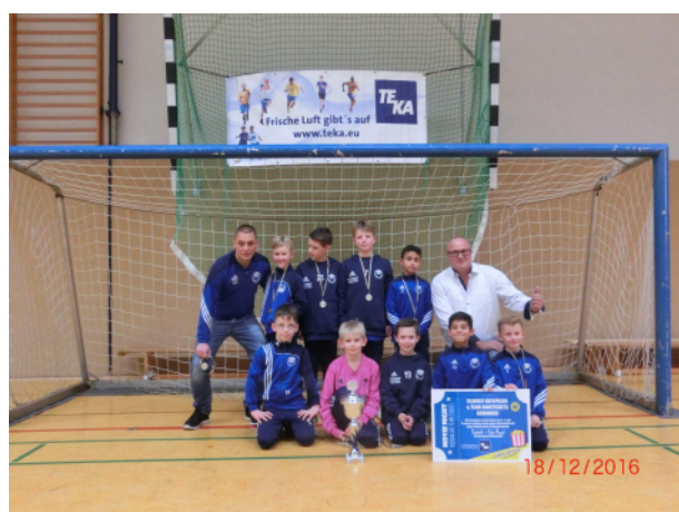
Foto: Der E-Jugend-Sieger SuS Stadtlohn

Auch bei der E-Jugend triumphierte die Mannschaft aus Stadtlohn. Nur der SC Südlohn konnte dem späteren Turniersieger einen Verlustpunkt beibringen und wurde somit Zweiter. Gefolgt von den Teams aus Weseke und den Punktgleichen Mannschaften aus Oeding und Burlo.