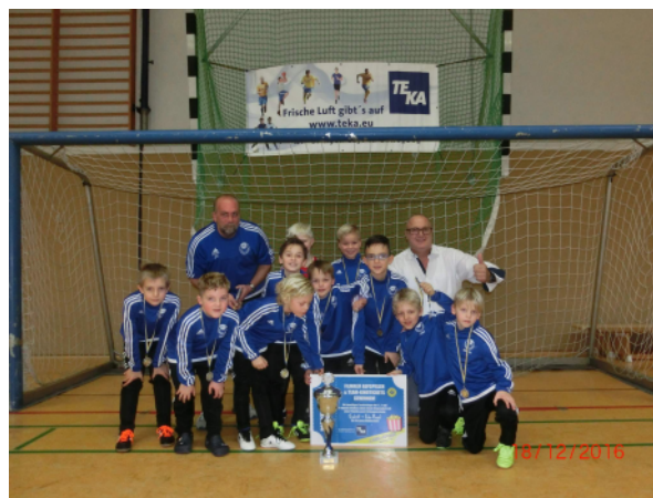
Foto: Der F-Jugend-Sieger SuS Stadtlohn

Am vergangenen Sonntag ist in der Nünningssporthalle Borken – Gemen der 1. TEKA – Cup für Jugendmannschaften über das Parkett gegangen. Am frühen Morgen starteten die F- und E- Jugendlichen ihre Turniere. In fair und von den Spielleitern ohne Probleme zu leitenden Spielen setzte sich bei der F-Jugend der SuS Stadtlohn mit der vollen Punktzahl durch. Als guter Gastgeber erwies sich die Truppe von Adler Weseke, die Platz 2 in der Endabrechnung vor den Teams aus Oeding, Burlo und Raesfeld belegte.