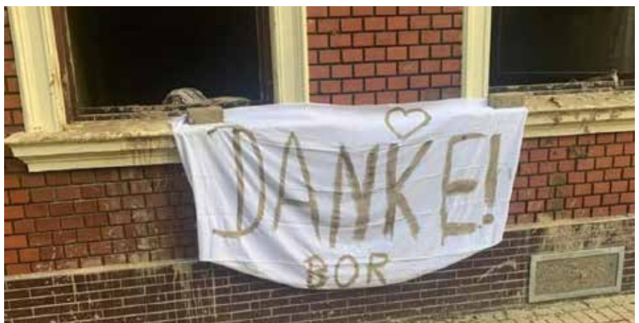
Dieses "DANKE" wurde mit Schlamm geschrieben.

Zusammen mit der Bundeswehr wurden Schulen vom Schlamm befreit und vom Inventar geräumt, um später Notunterkünfte zu errichten. Privathäuser wurden gemeinsam mit den Bewohnern aufgeräumt und teilweise entkernt. Freiwilligen, die mit Pendlerbussen aus Koblenz kamen, räumten unter der Leitung des THW verlassene Mietshäuser aus, um den anfallenden Müll anschließend mit den schweren Maschinen der Borkener Helfer zu den gigantischen Müllhalden zu fahren. Während es am Anfang noch an Getränken und notwendigen Betriebsstoffen, wie zum Beispiel Ad Blue mangelte, so spielte sich das später ein. Versorgt durch Malteser, Rotes Kreuz und die vielen Freiwilligen, gab es für uns Helfer keinen Man-