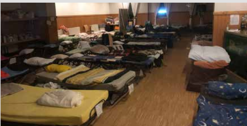
Schlafraum der Borkener Helfer

net sich nach gut zwei Stunden das idyllische Ahrtal mit seinen Weinbergen und der wunderschönen Natur. Die Autobahnabfahrt nach Bad Neuenahr-Ahrweiler bringt den Reisenden dann plötzlich in eine Stadt, die von Blaulicht, Baufahrzeugen und Treckern erfüllt ist. Die riesigen Müllberge und Schrotthalden mit Hunderten von Autos säumen fast jeden freien Platz. Über allem liegt der Staub des mittlerweile getrockneten Schlammes, der von den schweren Fahrzeugen aufgewirbelt wird und schon von der Autobahn als Wolke zu erkennen ist.