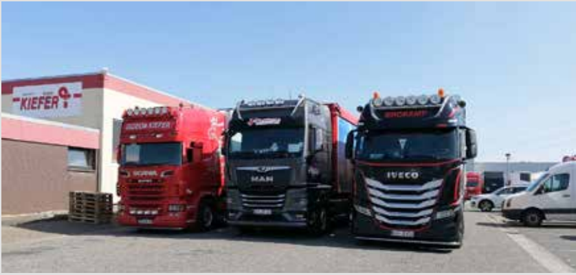
Die Firma Brokamp unterstützte mit dem Lkw rechts im Bild einen von mehreren Hilfstransporten.