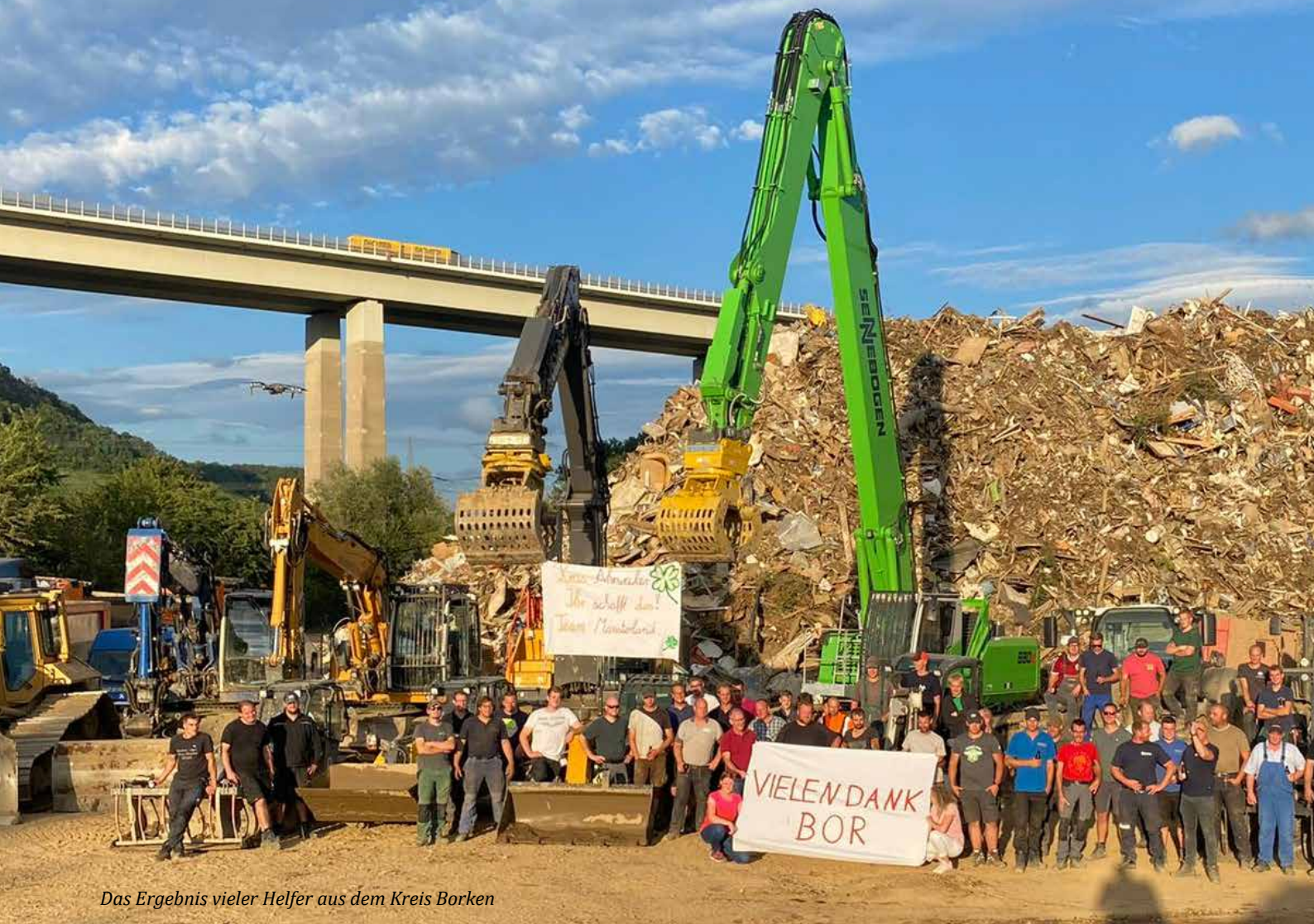
Das Ergebnis vieler Helfer aus dem Kreis Borken