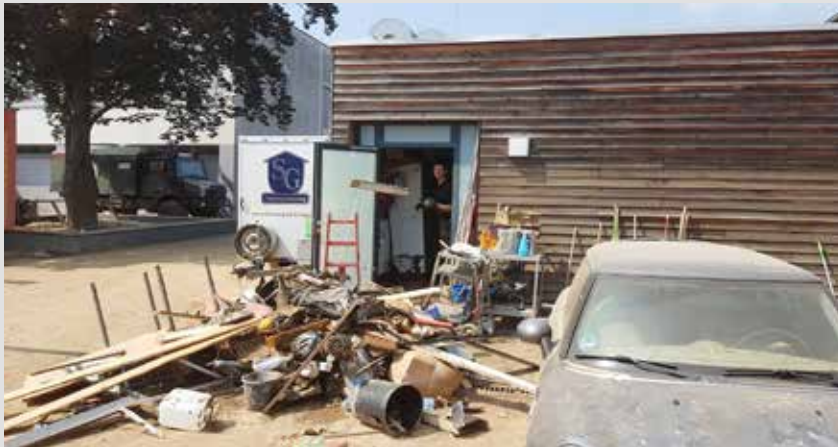
Räumung einer Schule