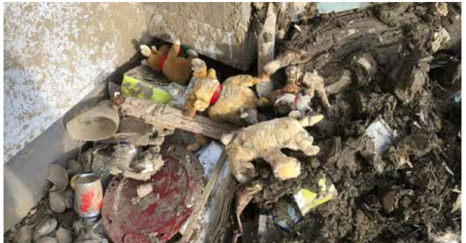
Bilder, die betroffen machen

reitschaft in ihrer neuen Weseker Wahlheimat. Die Praxis wurde am folgenden Freitag und Samstag förmlich überrannt und mit Sachspenden geflutet, so dass aus der geplanten PKW-Kolonnie ins Ahrtal schnell ein Konvoi aus drei LKWs wurde. Dies wurde unter anderem durch die Firma Brokamp aus Wesike ermöglicht, die einen dieser Lastkraftwagen mit Fahrer zur Verfügung stellte.