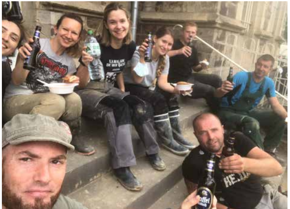
Weseker, Ahauer und Koblenzer machen Mittag. ESSEN UND LACHEN HILFT