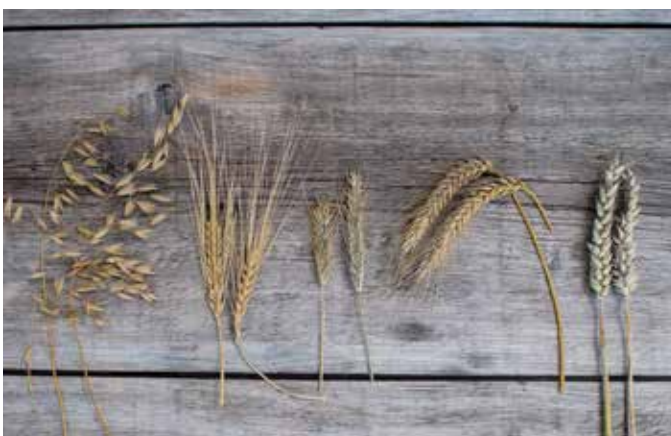
1. Hafer 2. Gerste 3. Roggen 4. Triticale 5. Weizen