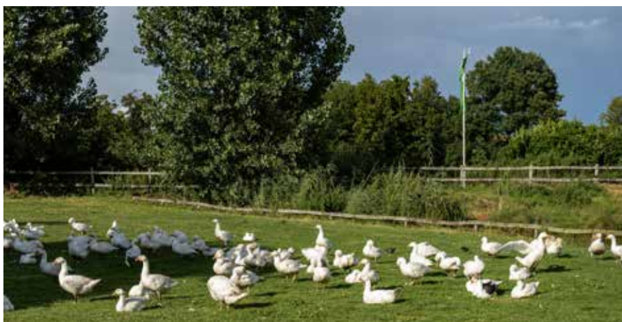
Zur Weihnachtszeit gibt es im Hofladen bratfertige Weidegänse und Enten.

Die über 150 verschiedenen Sorten können ab September im Hofladen erworben werden. Fast alle Kürbisse sind essbar. Maria Börger hat für viele ihrer Sorten passende